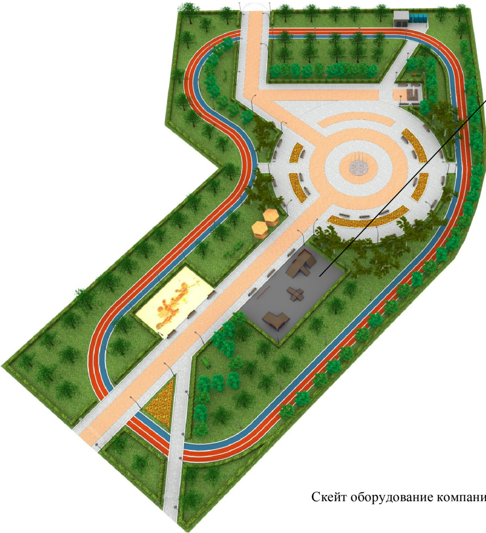
Скейт оборудование компании "Мастер" (г.Красноярск)