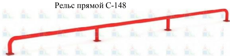
Рельс прямой С-148