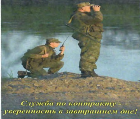
Служба по контракту - уверенность в завтрашнем дне!